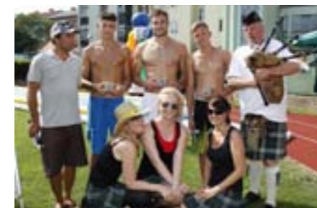
Die glorreichen, starken Sieger der Highland-Games!