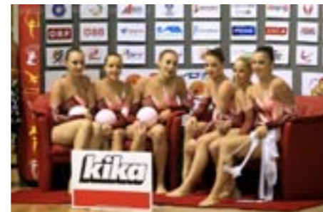
Die beliebteste Mannschaft des Jahres: Die RG-Elite