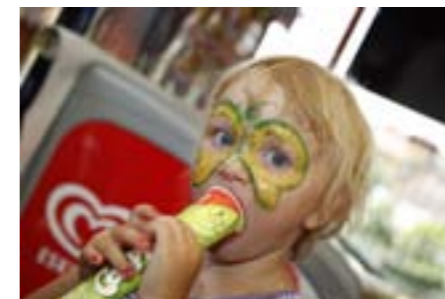
Schminkstudio für unser Jüngsten